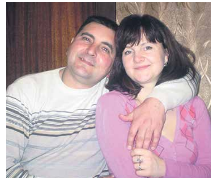
З коханою дружиною

1998-го закінчив Стахановський гірський технікум, отримавши офіцерські погони, обійняв посаду ДІМ – і значну частину міліцейської кар'єри присвятив саме нелегкій роботі «на землі», у ролі сільського «шерифа».