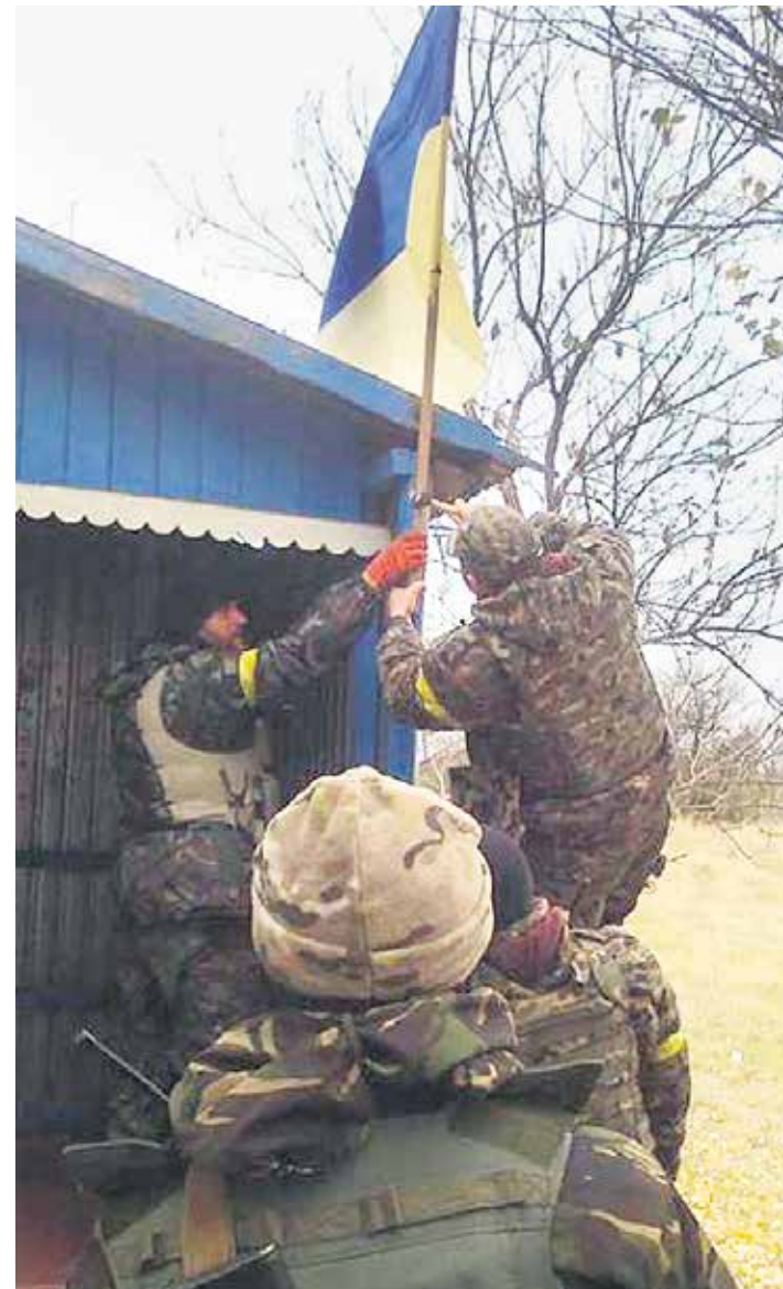
Український прапор над Кримською сільською радою. Жовтень 2014 р.