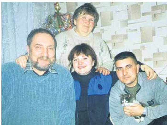
У родинному колі