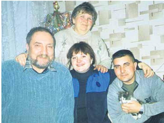
У родинному колі